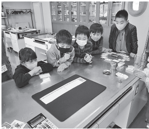
マジック?で遊ぼう