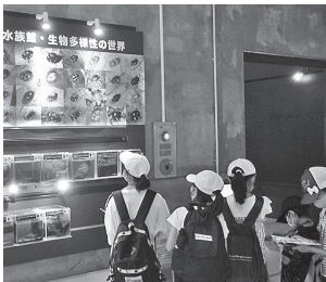
カワセミ水族館見学