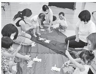
ももちゃんクラブ (親子で楽しくリトミック)