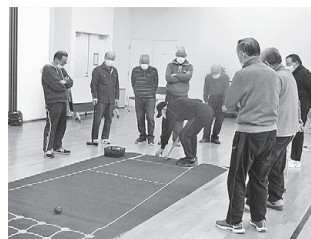
男性チャレンジスクール (ニュースポーツ体験)