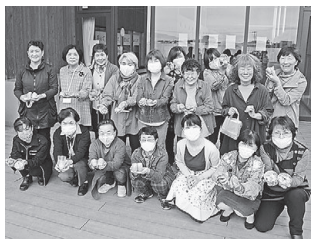
女性スクール「はなもも」 (アロマ石鹸づくり)