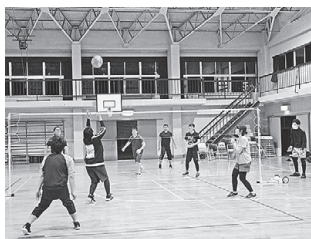
ICA・KITAヤングカレッジ (ソフトバレーボール大会)