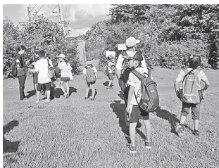
「遊びのがっこう」 (ウォークラリー)

1年間たいへんありがとうございました。 来年度も多彩な講座を企画したいと思います。 (掲載写真：活動のひとコマです)