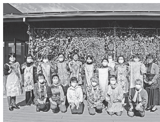
女性スクール「ぎんなん」 (染色体験)