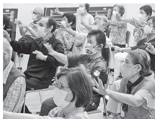
ながいき大学 (ロコモ予防・認知症予防講座)