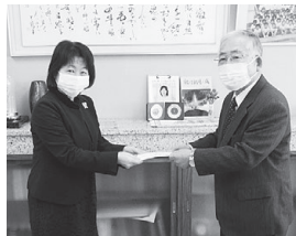
湯野小へ義援金贈呈