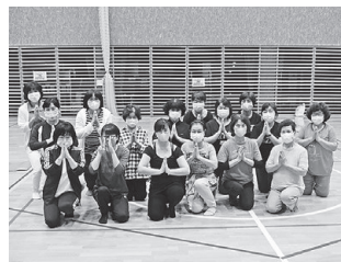
女性スクール「よざくら」 (ルーシーダットン体験)