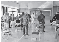
心と身体の健康体操