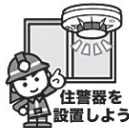
住警器を 設置しよう