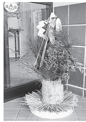
作成したミニ門松