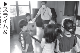
▶スライム&空気砲作り