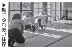
▶親子ふれあい体操