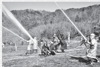
▲消防本部・消防団による放水訓練