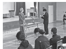
代表によるお礼のこたば