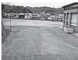
多目的ホール東側駐車場

※車いすをご利用の方、または体が不自由な方は、正面玄関前に駐車することも可能ですので、事務室職員にご連絡ください。