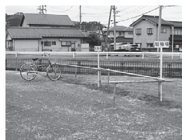
仮駐輪場(正面玄関前)