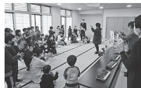
「おんぶトカンパニー」の見学