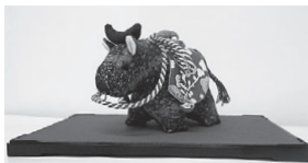
寄贈いただいた「丑」のぬいぐるみ

今回、寄贈されました「丑」のぬいぐるみは、当館図書室に置いてありますので、ぜひご覧ください！