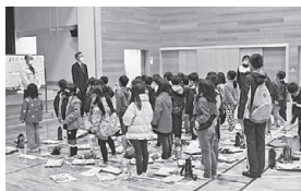
多目的ホールでの全体の説明

学習センターの役割と利用方法、小学生向け的主催事業や図書室についての説明を行いました。また、利用登録団体学習会の様子も見学しました。最後に、館長より「小学生児童のみなさんも積極的に図書室や学習として利用してほしい」ことを伝えました。