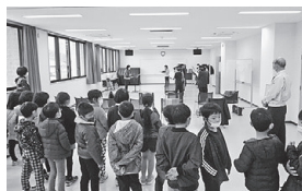
「コール・わたり」の見学