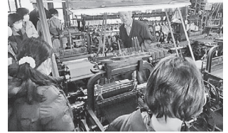
(女性スクール)～館外学習～