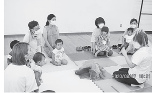
(ももちゃんクラブ)～リトミック～