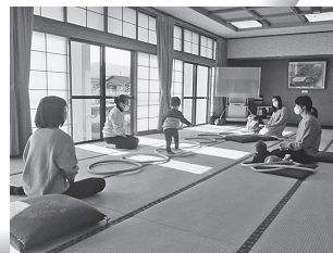
親子ふれあい体操