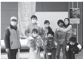
折り紙ヒコーキを飛ばそう！