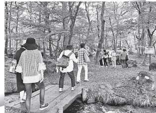
館外学習：エールの撮影地訪問