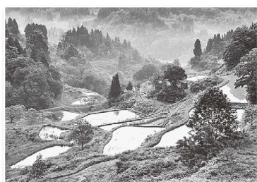
「初夏の棚田」 高橋哲也

里山の原風景と言われる 棚田です。新潟県十日町市 の初夏の朝です。心が洗わ れるおもしろい撮影しました。