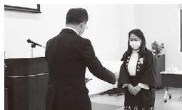
飯坂赤十字奉仕団