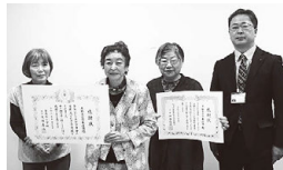
平野赤十字奉仕団