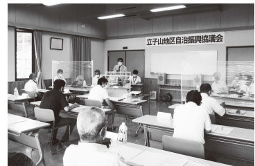
▲昨年度の自治振興協議会開催風景