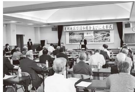
▲活発な意見が交わされた自治振興協議会総会

また、同日、功労表彰式が行われ、長年にわたり地区の発展に貢献いただいた方々が受賞されました。