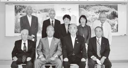
▲表彰受賞者の皆さまおめでとうございます。