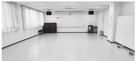
【講義室1・2の付帯設備】