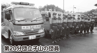
第20分団立子山の団員