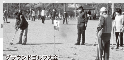
グラウンドゴルフ大会