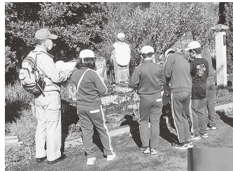
「歴史教室」 講師による史跡説明

10月20日(水)平石小5・6年生5名が、「平石の歴史教室」で、平石地区のフィールドワークを行いました。11月17日(水)には、成川の矢吹邸を訪問し、「矢吹邸 茶道・お琴教室」を行いました。信夫学習センターは、学校支援活動として、企画や運営の支援を行いました。