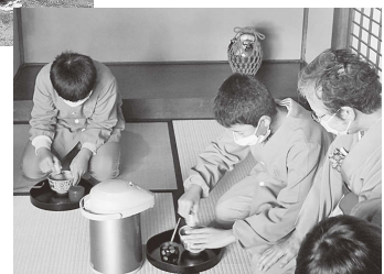
「茶道・お琴教室」 お茶のたて方体験