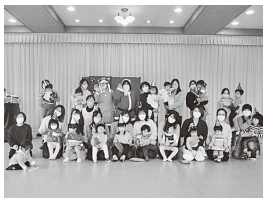
(クリスマスパーティ)

「いちごクラブ」は1～4歳のお子さんとその保護者で月に1回程度、季節に応じた活動や楽しいリトミック親子ふれあい活動などを実施しています。親子の成長が活動に参加することにより実感できます。