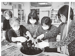
(あづまレディース 藍染め)

年齢などに応じて「あづまレディース」「ひまわり学級」「小富士学級」の3つの学級を開設しています。健康、料理、手芸、施設見学など、多様な活動に取り組んでいます。