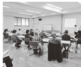
(第727回満月会「満月会の歩み」)

第1回満月会は大正10年(1921年)8月19日満月の夜に始まり、令和3年(2021年)は100周年記念の年となりました。満月会の精神は生涯学習の先駆けであり、現代に引き継がれています。