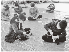
(正月飾り輪通し作り)

小学4～6年生からなる「スノーラビット」は社会体験、自然体験、スポーツなどを行います。また、楽しい集団生活を通して、子どもたちの協調性、自主性の育成を図ります。