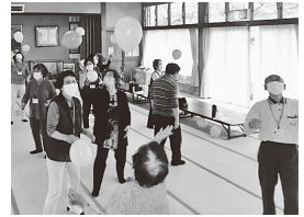
(庭坂寿大学 健康体操)

60歳以上が参加する「野田明大学級」「庭坂寿大学」「庭塚大学」「水保長寿大学」がそれぞれの地名の地区に、更に吾妻全地区「熟年パワースクール」があります。健康長寿を目指します。