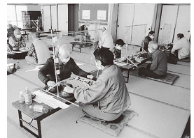
(新春囲碁フェスティバル)

秋の文化祭と活動発表会が最大のイベントですが、その他にも満月会や囲碁フェスティバル、吾妻地区体育連盟との共催事業などを開催しています。