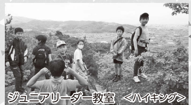
ジュニアリーダー教室 <ハイキング>