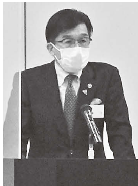
来賓として祝辞を述べる 木幡浩福島市長