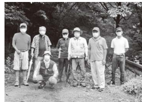
男性チャレンジスクール (万世大路)