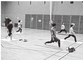
ICA・KITAヤングカレッジ (エクササイズ)