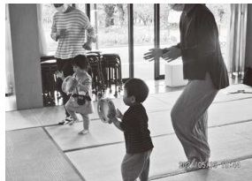
ももちゃんクラブ (ミュージックセラピー)