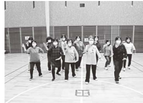
女性スクール「よざくら」 (太極拳体験)