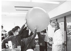
「遊びのがっこう」 (科学工作教室)

1年間たいへんありがとうございました。 来年度も多彩な講座を企画したいと思います。 (掲載写真：活動のひとコマです)