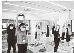
女性スクール「ぎんなん」 (リンパマッサージ)