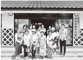
女性スクール「はなもも」 (館外学習)