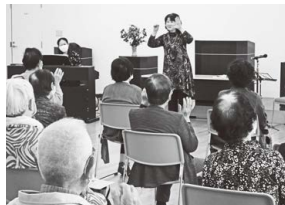
ながいき大学 (音楽と朗読)