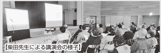
【柴田先生による講演会の様子】