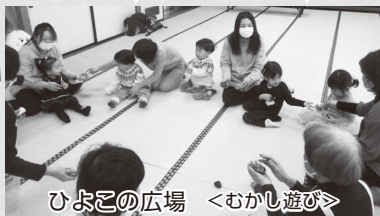
ひよこの広場 <むかし遊び>