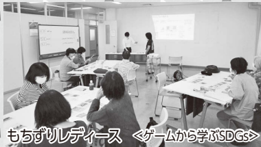
もちずりレディース <ゲームから学ぶSDGs>