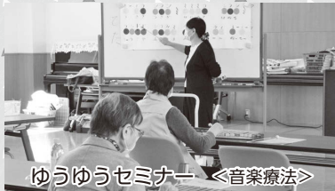
ゆうゆうセミナー <音楽療法>