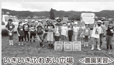
いきいきふれあい広場 <農園実習>