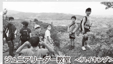
ジュニアリーダー教室 <ハイキング>