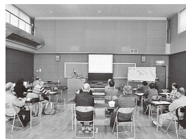
▲歴史講座(福島史跡10選 そして西地区へつづく旅)