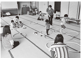
▲親子ふれあい体操