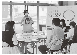
▲パーソナルカラー講座