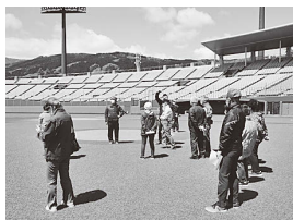
▲大人のための社会科見学 (あづま球場)