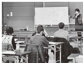
▲市民学校 (健口(けんこう)教室)