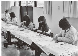
▲消しゴムはんこで 手作り年賀状

子ども達が農業体験やレクリエーション、ものづくりなどを通して、たくさんの事を学びました。