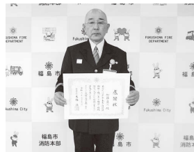
▲46年間、お世話になりました

昭和50年2月の拝命から多くの火災などの現場を指揮し、安全で安心な地域づくりに貢献され、また、多くの後進の消防団員を育て、消防団活動の進展に寄与されましたことに感謝いたします。