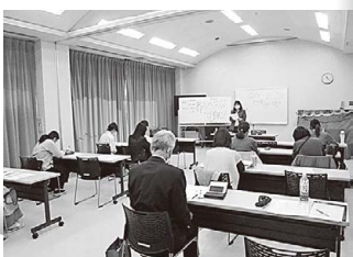
はじめての薬膳講座