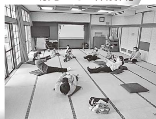
親子ふれあい体操