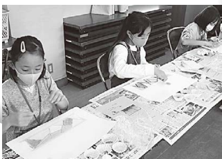
パステルランタンアート制作