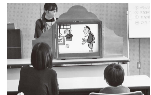
昨年のおはなし会の様子