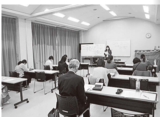
はじめての薬膳講座