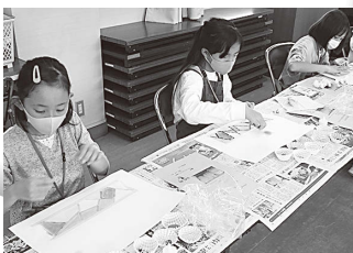
パステルランタンアート制作