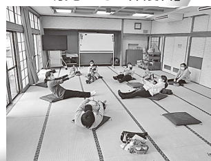
親子ふれあい体操