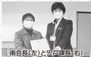
南会長(左)と戸課長(右)

「適しおサポーター」とは、市民一人ひとりの健康づくりを応援するため“食”の環境整備を推進する施設や団体を登録する制度で、当協議会は地域ぐるみで“減塩(適しお)”の普及・啓発活動を実施しております。