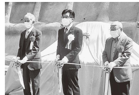
テープカット風景

当施設は、クリーンセンターで焼却された焼却灰等を埋め立て処分する施設で、6月より供用が開始される予定です。