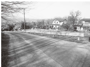
ガードレール設置

地域生活における身近な公共施設の整備により、住み良い地域づくりの推進を目的とした「地域基盤整備事業」を実施しました。令和3年度は20件の事業を行い環境整備に努めました。今年度も地域に即した事業を行いますのでよろしくお願い致します。