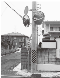
カーブミラー設置