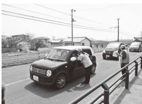
交通安全を呼び掛け

4月5日(火)に飯坂町平野地内の遮断機のない踏切において、飯坂電車と車が衝突する交通死亡事故が発生しました。再発防止の注意喚起を啓発するため、4月11日(月)には、福島北警察署や福島交通、交通安全母の会などの関係機関が集まり、事故現場付近で広報啓発活動を実施しました。飯坂線沿線は、遮断機のない踏切が数多く設置されていますので、皆さまも踏切を通行する際は、十分に安全確認を行うようご注意ください。