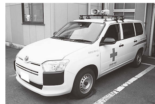
支所に配備された赤十字救援車

救援車は環境に配慮したハイブリッド車で、災害時の物資輸送をはじめとする赤十字事業のほか、地区内のパトロールや広報、市政だよりの配送などで使用します。