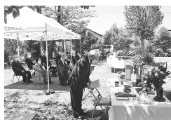
戦没者を追悼した参列者