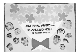
こどもたちからのメッセージ

記念品には、御山保育所のこどもたちから高齢者に向けて、「おじいちゃん、おばあちゃん、ずっとげんきでいてね！」と健康長寿を願う心温まるメッセージが同封されました。