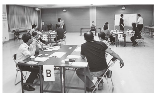
グループワークの様子