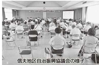
信夫地区自治振興協議会の様子