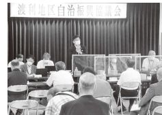
▲木幡市長と意見交換する地区のみなさん