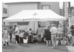
▲JAふくしま未来渡利支店駐車場