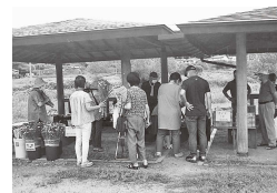
▲花見山ウォーキングトレイル駐車場