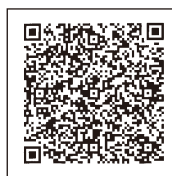
凍み豆腐を使ったレシピも掲載中!