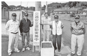
交通安全看板設置