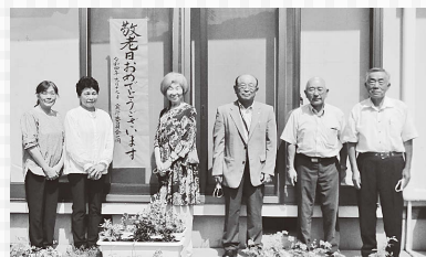
各町会への配付にお世話になりました、大波方部民生児童委員の皆さん