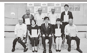
受賞した戸さん(後列右から2人目)

戸さんは、40年以上の長きにわたり地区の農道等の美化活動を続けていらっしゃいます。このたびは誠におめでとうございます。