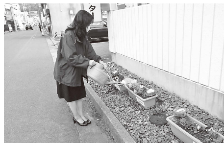
▲信夫山ストリート沿線の皆さんにお世話になります