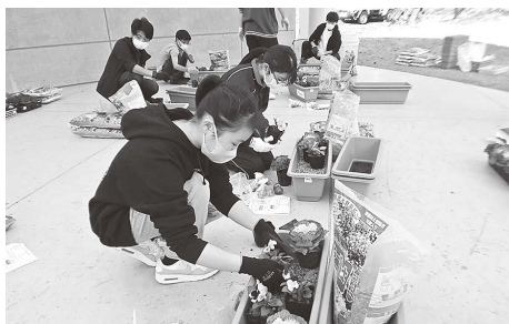
▲14人の生徒に参加いただきました