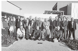
伝承館での見学の様子