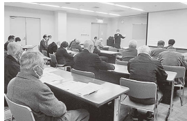
こども食堂の話を聞く様子

両施設の見学を通して、こども食堂について理解を深められ、また、防災・減災の意識醸成が図られました。