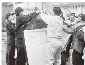
避難所開設支援(簡易テント設置)訓練の様子

皆さんも、災害時の避難経路、家族との連絡方法、コロナ禍にも備えた非常持ち出し品の確認等をお願いいたします。