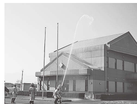
送水・放水訓練の様子