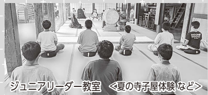
ジュニアリーダー教室 <夏の寺子屋体験など>