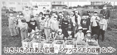
いきいきふれあい広場 <サツマイモの収穫など>