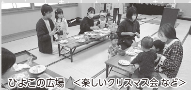
ひよこの広場 <楽しいクリスマス会など>