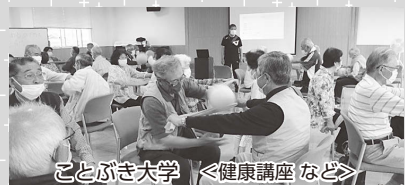
ことぶき大学 <健康講座など>