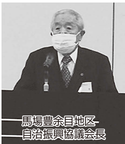
馬場豊余目地区 自治振興協議会会長

北信地区新年会は1月16日(月)、ウィル福島 アクティおろしまちにおいて、新型コロナウイルス感染症対策に留意しながら開催されました。