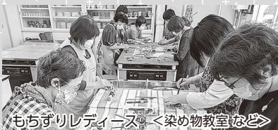
もちずりレディース <染め物教室など>