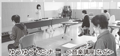
ゆうゆうセミナー <音楽講座など>