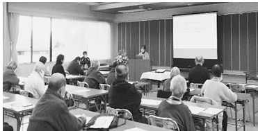
1月15日のセミナーの様子

なお、両日のお話は講演録にしてまとめておりますので、ご希望のかたは西支所までご連絡ください。