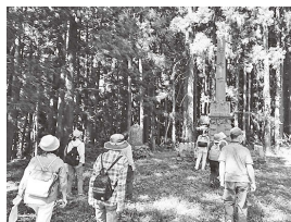
▲ヒストリーウォーク (松川八丁目)