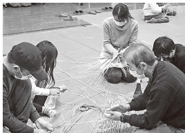
▲親子教室 「しめ飾り作り体験教室」