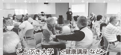
ことぶき大学 <健康講座など>