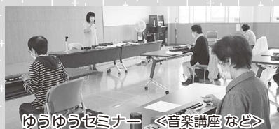
ゆうゆうセミナー <音楽講座など>