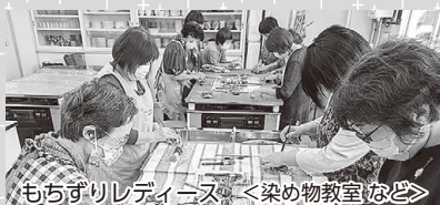
もちずりレディーズ <染め物教室など>