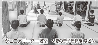
ジュニアリーダー教室 <夏の寺子屋体験など>