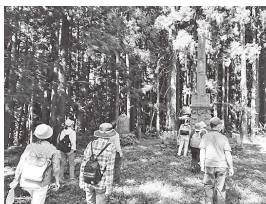
▲ヒストリーウォーク (松川八丁目)