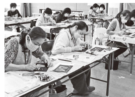
▲チョークアート教室