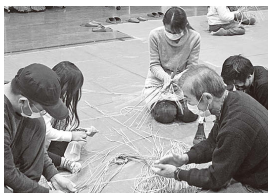
▲親子教室 「しめ飾り作り体験教室」