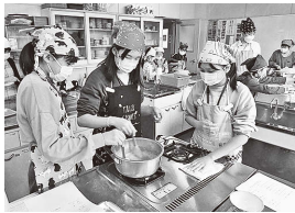
▲お菓子づくり体験

子ども達がものづくりやレクリエーション、調理体験などを通して、たくさんの事を学びました。