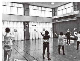
▲市民学校 (吹き矢体験教室)