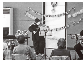
▲クリスマスコンサート