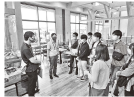
▲道の駅ふくしま見学