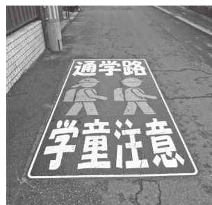
▲通学路の注意表示

令和4年度は11件の事業を行い環境整備に努めました。次年度も地域に即した事業を行いますのでよろしくお願いいたします。