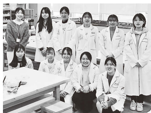
▲こくりナビからの参加者