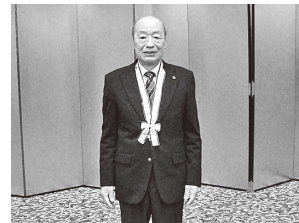
功労表彰を受賞された丹治会長