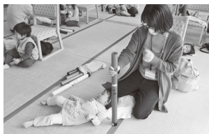
ブームワッカーで絶対音感