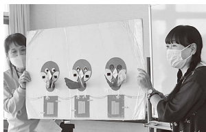
絵カードでリズムにのって