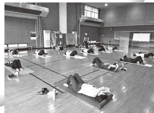
からだリセット体操