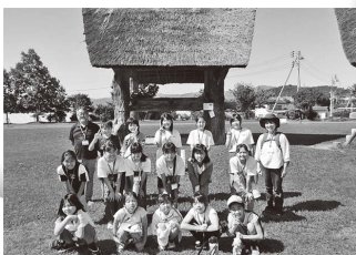
じょーもびあ見学