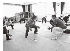
令和4年度の活動レポート