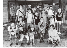
令和4年度の活動レポート