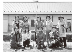
令和4年度の活動レポート