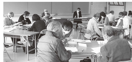
まちづくりについて話し合う委員

今年度第1回の清水まち懇では、泉・森合・南沢又・北沢又・御山の各地区から「安全安心なまちづくり」などの取り組みテーマについて報告があり、今後具体的な活動内容について検討を進めることを確認しました。