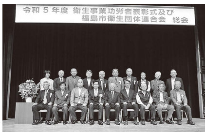
▲受賞された皆さま