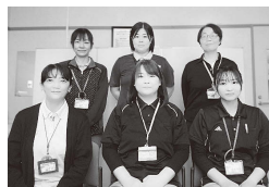
清水東地域包括支援センターの職員