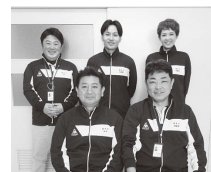
清水西地域包括支援センターの職員