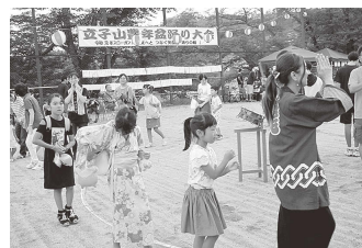
令和元年度開催時の風景